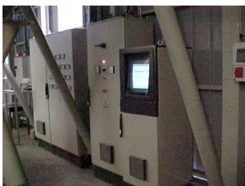
Armoires de la réception blé