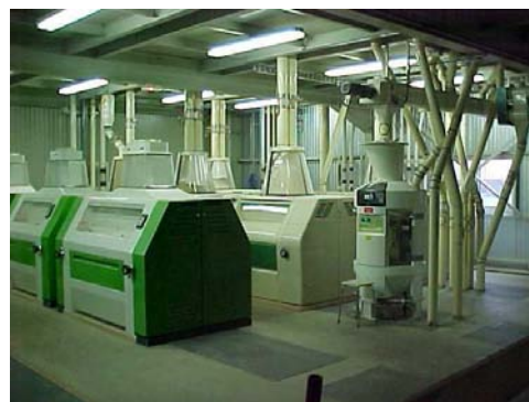
Vue du moulin