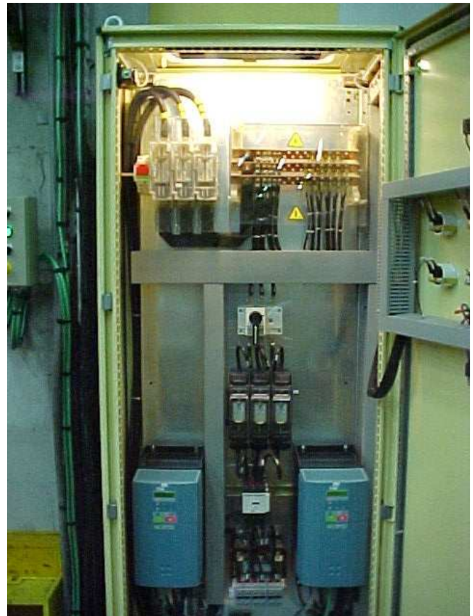
Variateurs DC 4Q Eurotherm 590+